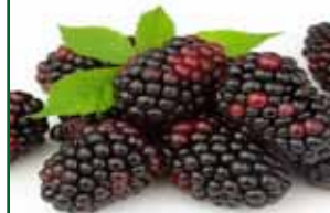
Mora de castilla