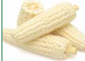
Choclos entero pelados