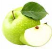
Manzana verde Imp.