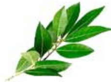
Hoja de naranja