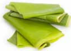
Hoja de platano