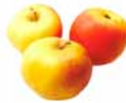
Manzana de jugo