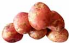
Papa chola grande