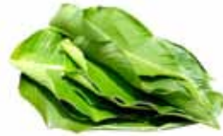
Hojas de Atchira