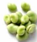
Habas con cáscara